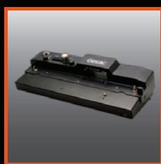
Station d'accueil pour bureau